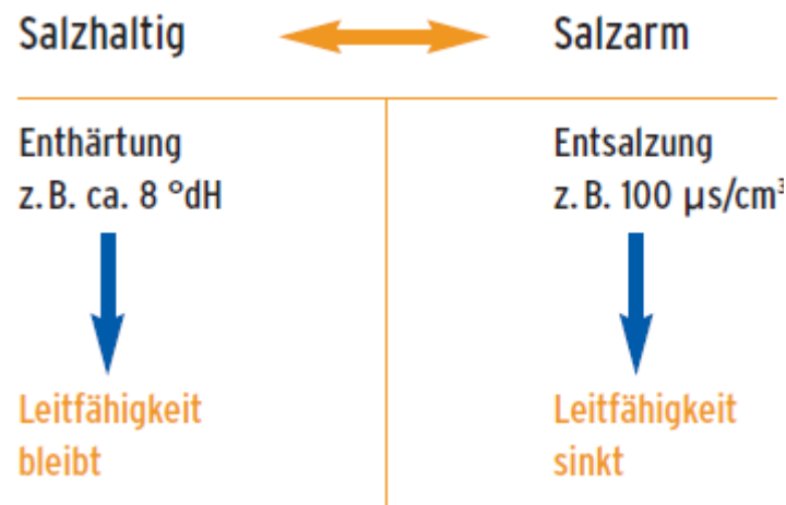
Gegenüberstellung salzhaltig - salzarm

Die „salzarme Füllweise“ ist eine sehr hochwertige und durchaus empfehlenswerte Heizungswasserkonditionierung, jedoch sollte der pH-Wert regelmäßig überprüft werden. Dieser kann unter einem bestimmten Wert absinken oder aber auch stark ansteigen. Die geringe elektrische Leitfähigkeit verringert eine galvanische Korrosion zwischen unterschiedlichen Metallen (unterschiedlicher Spannungsreihe).