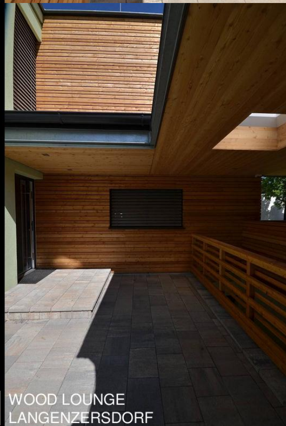
WOOD LOUNGE LANGENZERSDORF