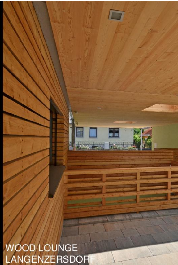
WOOD LOUNGE LANGENZERSDORF