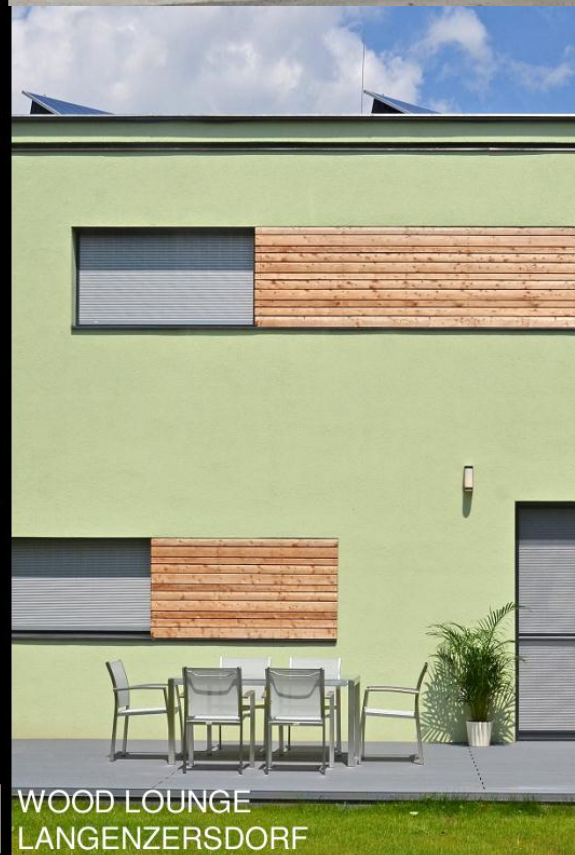
WOOD LOUNGE LANGENZERSDORF