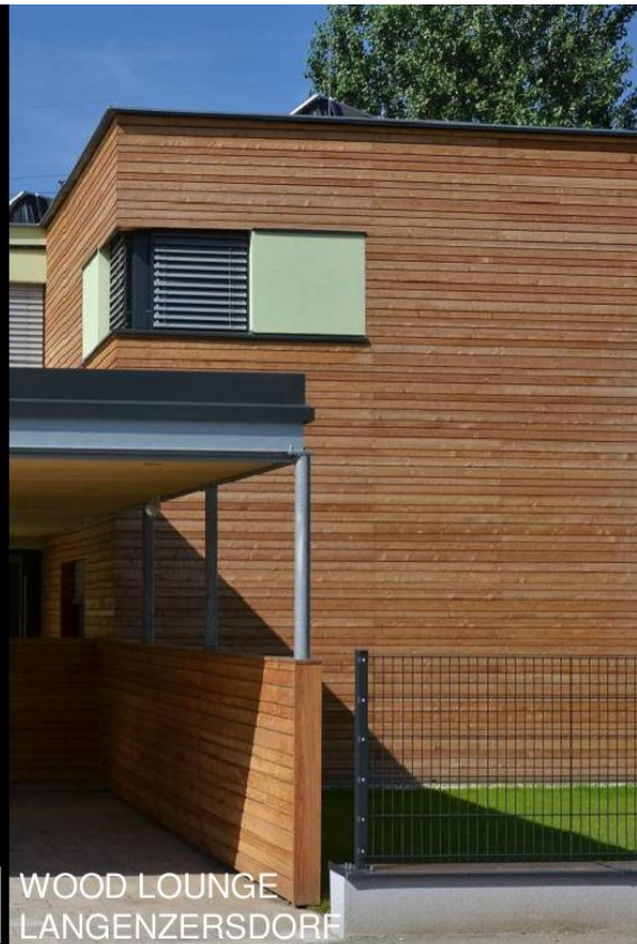
WOOD LOUNGE LANGENZERSDORF