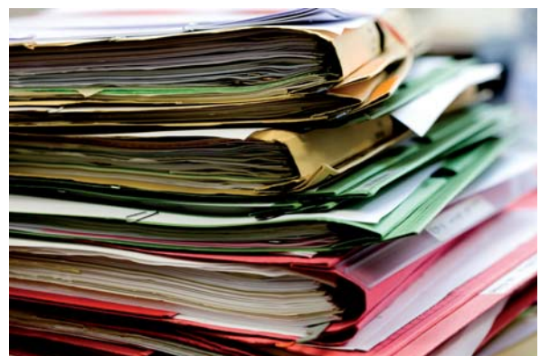
Bild 6 fordert Papieraufwand: Wartungsvorschriften und Herstellerangaben sowie WPK-Unterlagen

Auch bei nach Herstellerangaben wartungsfreien Beschlägen sind vor der Bauübergabe die Befestigungen zu kontrollieren und ggf. einzustellen.