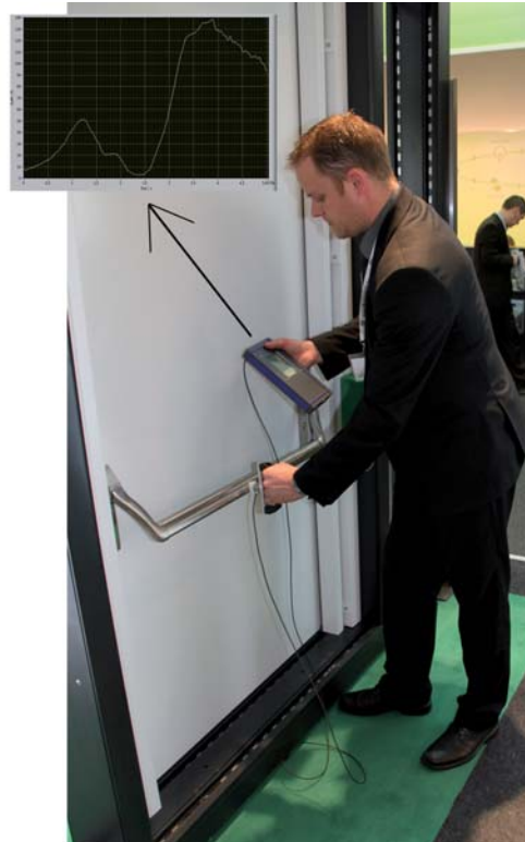
Bild 5 Messung der Freigabekräfte

Der Hersteller muss sicherstellen, dass der Monteur die erforderlichen Informationen und Hilfsmittel hat, um die Tür korrekt zu montieren und dies zu dokumentieren.