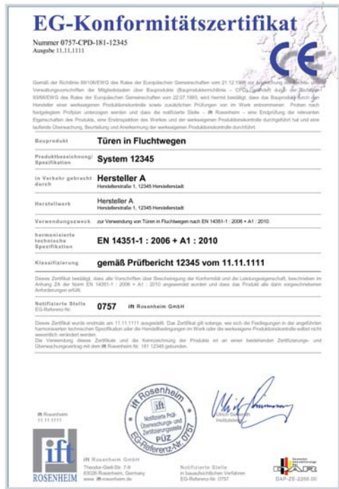
Bild 3 Muster eines EG-Konformitätszertifikat Fluchttür gemäß EN 14351-1

dass die Türen auch bei langjähriger Produktion die ausgewiesenen Eigenschaften aufweisen, die durch die Prüfung der ursprünglichen Tür nachgewiesen wurden.