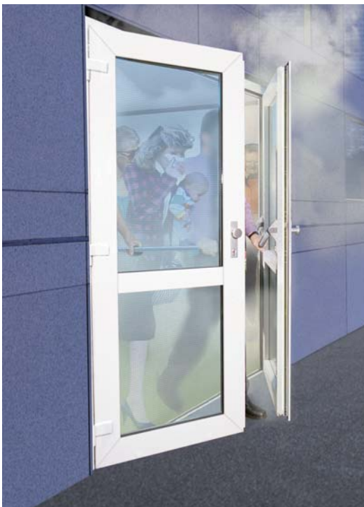
Bild 2 nach außen öffnende zweiflügelige Fluchttür im Brandfall

Falls in Deutschland an Türen in Rettungswegen elektrische Verriegelungssysteme verwendet werden sollen, unterliegen diese besonderen Regelungen. Elektrische Verriegelungssysteme (sog. Fluchtwegssicherungs- bzw. Rettungswegssicherungssysteme) unterliegen seit dem 1.5.1999